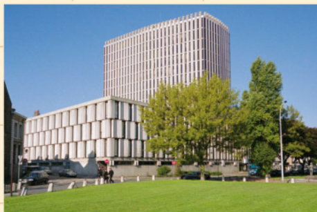
Le palais de Justice de Lille